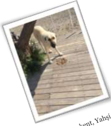
Bodrum Ortakent, Yahşi

Zekeriyaköy ormanlarında ve Bodrum Yahşi'de tatilcilerin terkettikleri dostlarımıza 300 kg mama desteğinde bulunduk.